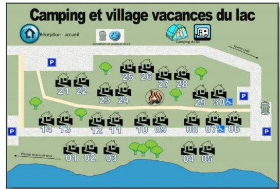
Plan du Village Vacances